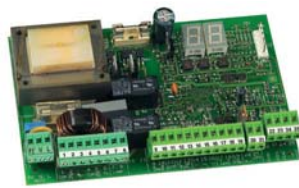
Kontrol kartı 455 D Teknik özellikler sayfa 141