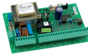
Kontrol kartı 462 DF (*) Teknik özellikler sayfa 142