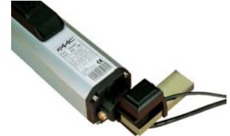
Gatecoder engel tespit kiti (ters yöne dönme fonksiyonlu) Teknik özellikler sayfa 153