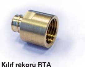
Kılıf rekoru RTA

(*) Sadece dipiprogram ya da Faactotum ile programlanabilir