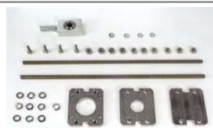
Pozitif Stop- açılma/kapanma mekanik stopları (uzun 400 modeline entegre edilebilir.)