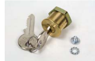
Özel anahtarlı boşa alma kilidi No. 1'den no. 36'ya kadar