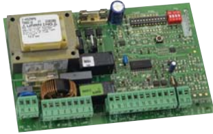
Kontrol kartı 452 MPS Teknik özellikler sayfa 140