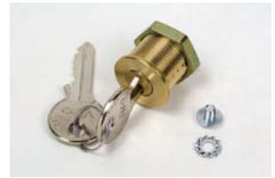
No. 1'den no. 36'ya kadar özelleştirilmiş anahtarlı boşa alma kilidi