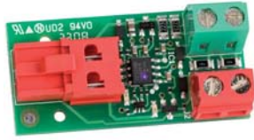
BUS XIB arayüzü (Eğer E024S kart BUS bulunmayan fotosel ile kullanılırsa)