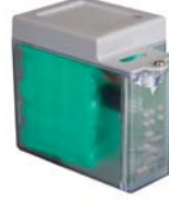
Acil durum batarya kiti XBAT 24