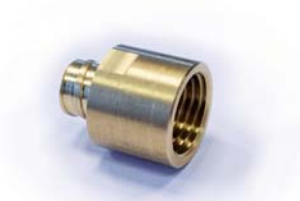
Kılıf rekoru RTA