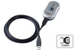
X-COM BOX modülü