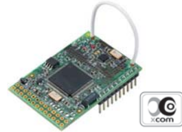
Verici-alıcı modülü X-COM