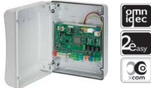
Kontrol ünitesi E 124 Tek. özellikler sayfa 152