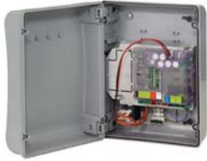
Kontrol ünitesi E 024S Tek. özellikler sayfa 151