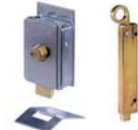
Çeşitli aksesuarlar sayfa 168