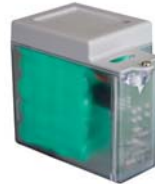
Acil durum batarya kiti XBAT 24 (Sadece E 124 için)