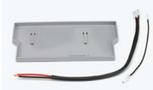
Acil durum batarya destek kiti (*) (Sadece E 124 için)