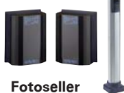
Fotoseller ve Kolonlar sayfa 163