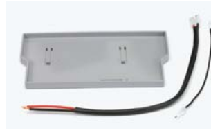
Acil durum batarya destek kiti (*) (Sadece E 124 için)