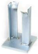
Duvara montaj plakası